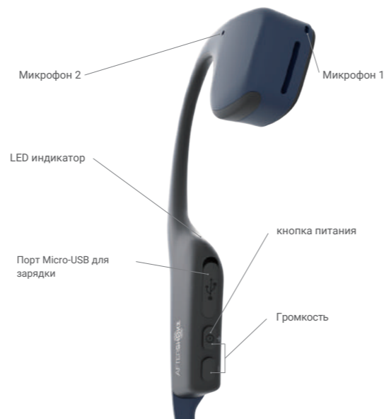
Микрофон 2 Микрофон 1 LED индикатор Порт Micro-USB для зарядки кнопка питания Громкость